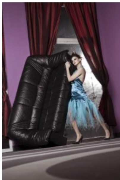
Haute couture szalont?

Természetesen. De külföldön is szeretnék majd szalont létrehozni.